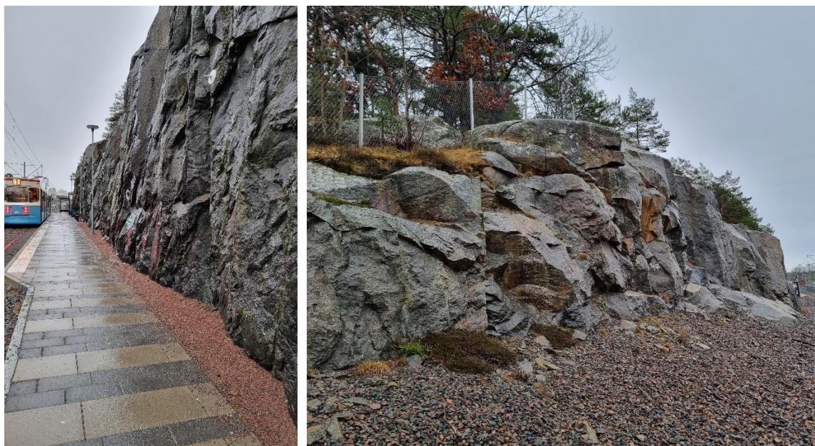
Figur 3 T.h. Planområdets västra delar, stabil, vy nordväst. T.v. Planområdets nordvästra delar, stabil, sydost.

Inga slänter med risk för blocknedfall noterades inom området och under rådande omständigheter bedöms slänterna som långsiktigt stabila.