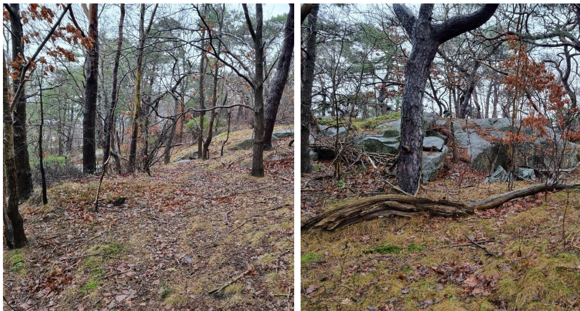
Figur 2 T.h. Planområdets mittersta delar, stabil, vy väst. T.v. Planområdets mittersta delar, stabil, vy nordöst.

I områdets västra del utgörs gränsen av planområdet av en ca 2-5m hög sprängd bergslänt. Slänten har befintlig bergförstärkning i form av bergbult och stabiliteten bedöms övergripande som god, se Figur 3.